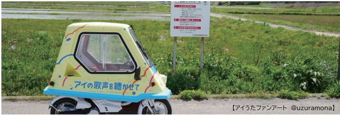
【アイうたファンアート @uzuramona】